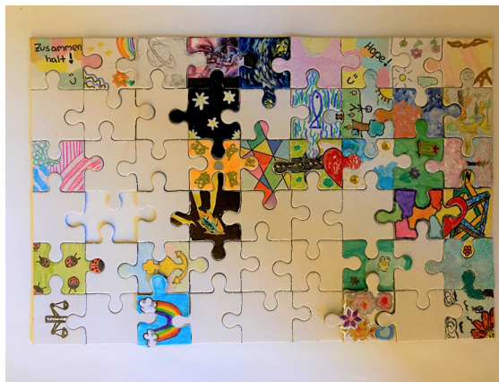
die Gemeinde wächst

Wir puzzeln uns wieder gottesdienstlich zusammen. Und doch – in den letzten Corona-Monaten, bzw. in den fast zwei Corona Jahren, ging das ein oder andere Gemeinde-Puzzleteil verloren. Auch bei meinem Puzzle gibt es geknickte Teile, es