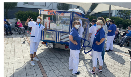
Fruchtgeschmack und Vanille waren der Renner für Bewohner und PflegerInnen.