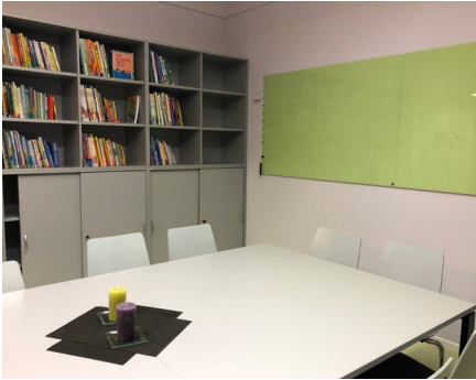
das neue Kita-Teamzimmer

Die neuen Möbel und Stühle sind da, die Schreib-Pin-Wand glänzt noch - doch bald wird sich hier Leben tummeln: Das Zimmer ist für das Team da - ebenso wie für kleine pädagogische Einheiten mit Kindergruppen.