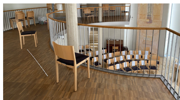
Gottesdienst in Corona-Zeiten: mit Mundschutz, ohne Singen und mit Abstandhalten

Änderungen der Termine vorbehalten! Bitte informieren Sie sich über die Aushänge oder im Internet ( http://www.maria-magdalena-fuerth.de )