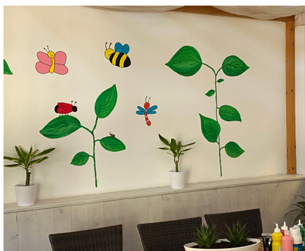
„summ, summ, summ...“

Nein – die Kitas waren nicht geschlossen in den letzten Wochen. Es bestand Betretungsverbot für Kinder und Jugendliche. Das Team war vor Ort und hat aus- und aufgeräumt, weggeworfen, neu eingeräumt, repariert und verschönert. Zum Beispiel die Wand im Elternsitzbereich. Fröhlich frisch ist es nun und fast, ja, fast hört man die schöne Biene summen. Und nachdem nun auch wieder Kinder in den Notgruppen sind (Stand Mitte Mai: 24 Kinder), ist auch wieder Lachen und Leben im Haus.