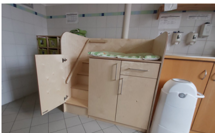
der neue Wickeltisch

Und den alten Wickeltisch haben wir nicht weggeworfen, sondern im ÖZ in der Damen Toilette aufgestellt für die Kita-Gastkinder aus Dambach. Denn die Kita-Gruppe, die für ca. 15 Monate bei uns zu Gast sein wird, hat noch das eine oder andere Wickelkind. Na, das passt doch prima.