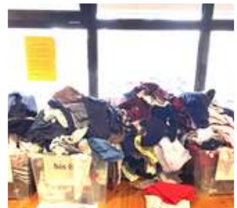
So ein Durcheinander!! Bitte haltet Ordnung am Kindersachentisch!

am Kindersachentisch im ÖZ. Schade! Jede Box gibt eine Größe an - doch manche wühlen sich lieber durch Kleiderhaufen - andere eher nicht. Aber die haben keine Chance. S.H.