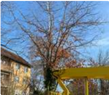
Bäume werden beschnitten