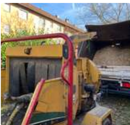
Baumbeschnitt und Häckseln - eine sinnvolle, aber „laute“ Aktion im Garten des ÖZ

Die Nachbarn haben keine Sonne, die Zweige zerkratzen und beschädigen das Schuppendach. Dornsträucher zerkratzen die Beine. Die Bäume im kleinen Garten und im Kindergarten waren wahrlich in den Himmel gewachsen. Mit tatkräftiger Hilfe von Herrn Reuther hat eine Baumfirma die Bäume und Sträucher beschnitten, kleine Bäume ausgeschnitten und Totholz entfernt. Und dann alles gehäckselt. Das war ziemlich laut, aber so konnte alles an einem Tag abtransportiert werden. Jetzt ist wieder Sonne auf den Balkonen und die Kinder können zwischen den Bäumen toben und verstecken spielen und keine kratzigen Sträucher gefährden Arme und Beine. S.H.