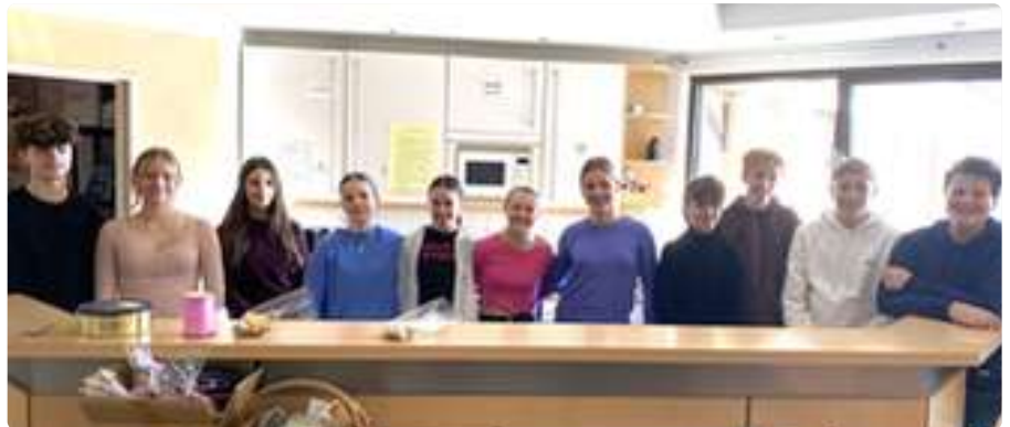
Sie bereiten sich auf die Konfirmation vor.