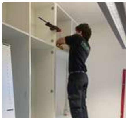
Endlich! Ein großer neuer Schrank für das Leitungszimmer in der Krippe.

...ist unsere Konfigruppe. Jetzt geht's im März noch zur Konfi-Freizeit in die Sachsenmühle und dann wird bald Konfirmation gefeiert. Eine fröhliche Gruppe! S.H