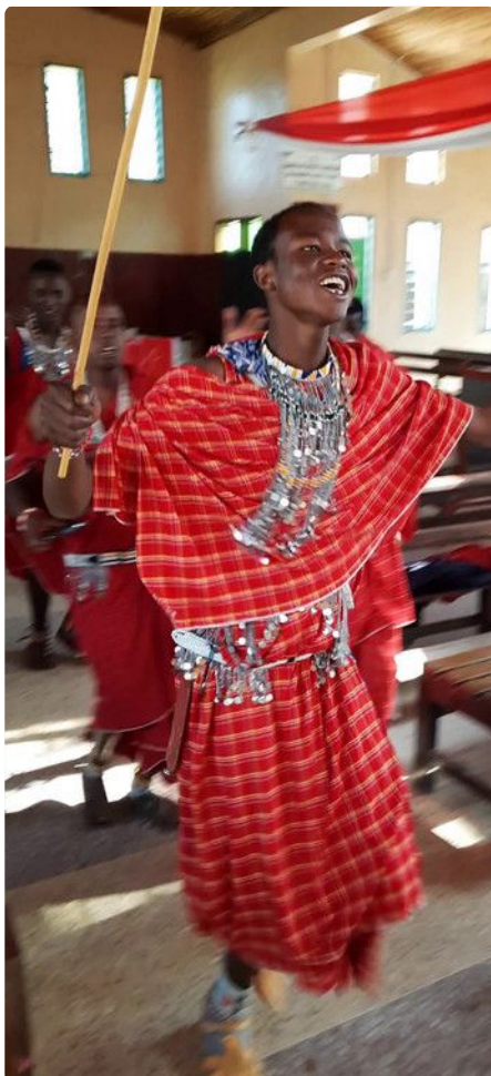
Massai beim Tanzen

Die Massai sind ein Volksstamm, der in Tansania und in Kenia verbreitet ist. Ursprünglich waren sie ein Hirtenvolk.