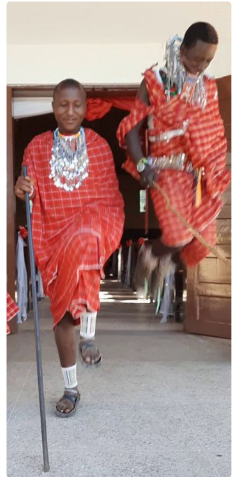
Springen ist Teil des Tanzes

Vor allem beim Tanzen tragen Massai rote Tücher mit Streifen- oder Karomuster und haben dazu silbernen Schmuck um den Hals. Frauen schmücken auch ihren Kopf mit blinkenden Silberblättchen. Junge Massai-Männer sind oft mit Stöcken unterwegs, um sich z.B. gegen Löwen verteidigen zu können. Auch beim Tanzen kommen sie spielerisch zum Einsatz.