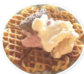
Gemeinsam Eis schlemmen

Heider. Du solltest allerdings schon konfirmiert sein. Und am 26. Oktober um 16 Uhr treffen wir uns dann im ÖZ. Da stellen sich alle kurz vor, die sich zur Wahl stellen und dann wird gewählt. Und wählen dürfen ALLE Jugendlichen der Gemeinde! Und es wäre toll, wenn viele kommen und mitwählen, vor allem, weil es danach ein gemeinsames Essen gibt und viele tolle Spiele (Werwolf bei Kerzenschein, Monopoly Marathon, elektrisches Magnet Dartwerfen, Tischtennis, Kicker und mehr). Und wer Lust und die Erlaubnis der Eltern hat, kann einfach dableiben und im ÖZ übernachten, d.h. wenn ihr zum Schlafen kommt. Am 27.10. früh oder vielleicht auch eher gegen Mittag gibt's dann Frühstück, Schlafsäcke einrollen, ÖZ aufräumen und ab nach Hause. Also bitte Zettel an den Kühlschrank hängen und allen Jugendlichen aus MM, die du kennst weitersagen: Am 26. Oktober ist Jugendausschusswahl! Bitte wähle DU mit!