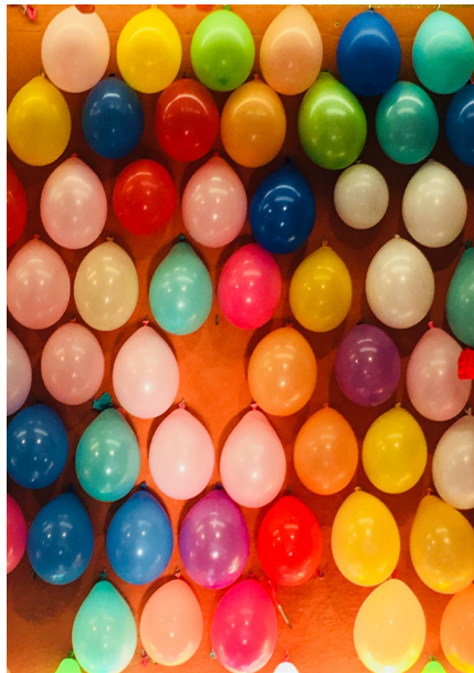
Spickerbude Fürther Kirchweih

20 Jahre Gemeinde Maria Magdalena in der Kalbsiedlung - Südstadt - Gartenstadt